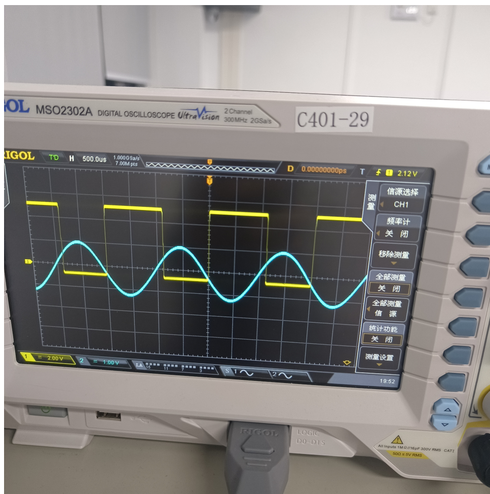
图 1: 图 12-1 过零比较电路波形图

波形分析: 当输入正弦波 U_I 从负变正穿过 0V 时, 输出 U_O 从 +U_{OM} 跳转到 -U_{OM} 。反之, 当 U_I 从正变负穿过 0V 时, U_O 从 -U_{OM} 跳转到 +U_{OM} 。输出为与输入信号同频的方波, 相位相反, 验证了过零比较功能。